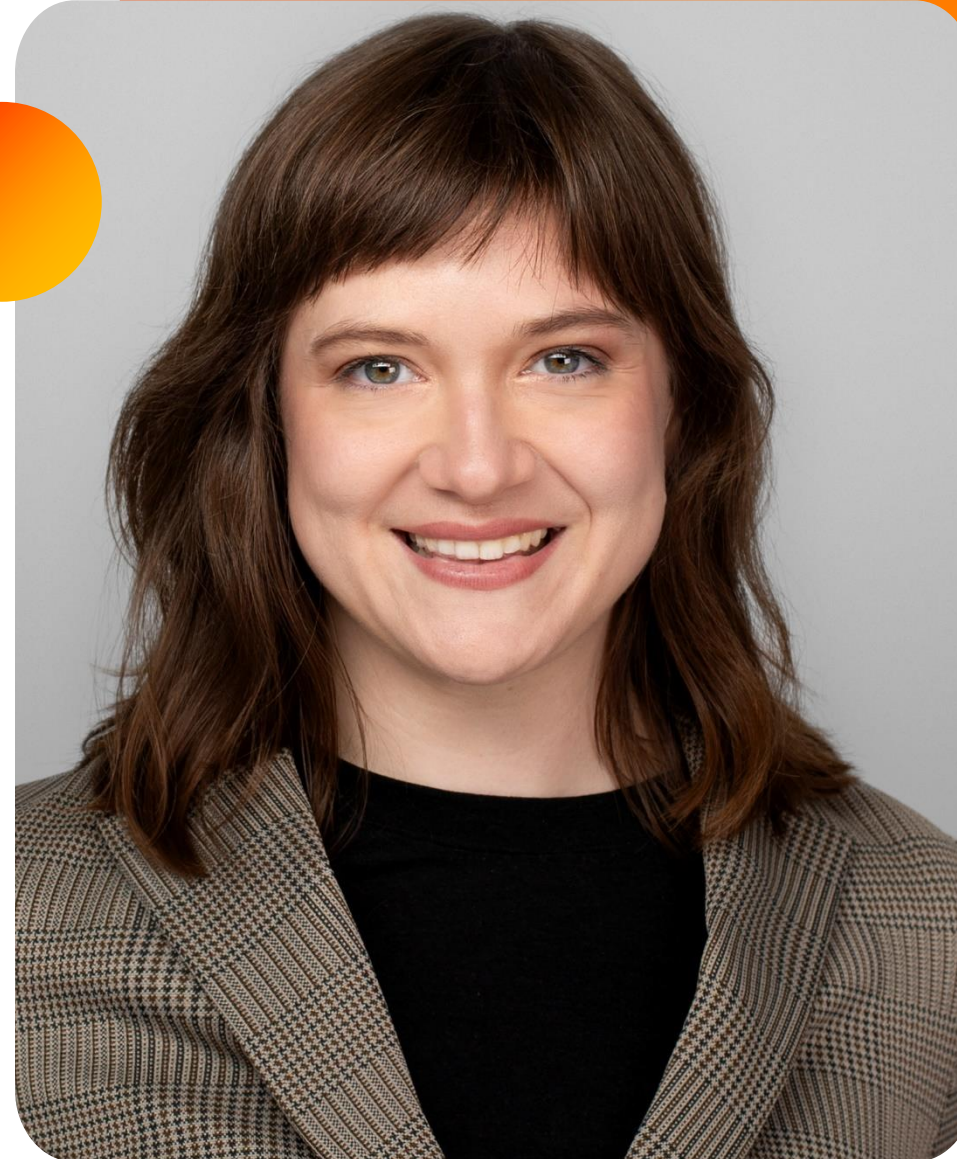
Anna Maria Ortese